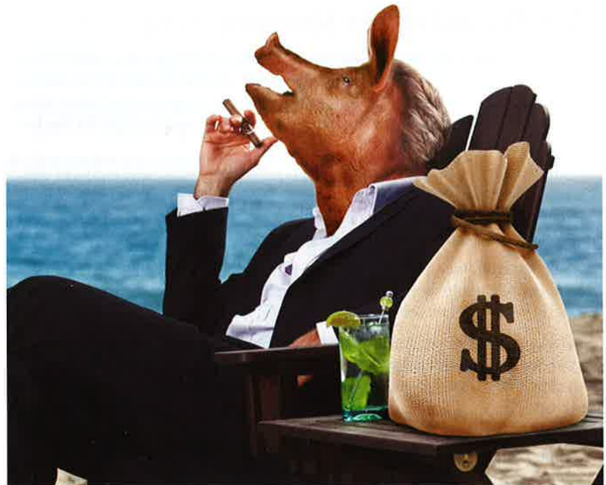
Die Täter sitzen im Nadelstreifen-Anzug an den Schaltstellen der Macht

Wir können davon ausgehen, dass anfangs MitarbeiterInnen ihr Bestes geben wollen. Gewiss, es gibt Ausnahmen, aber die Erfahrung zeigt doch, dass der größte Teil recht freudig und einsatzbereit an eine Sa-