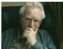
DVD 01 / 01

Die Fragen „des“ Lebens lassen sich nur beantworten ... indem wir „je unser“ Leben verantworten. 6